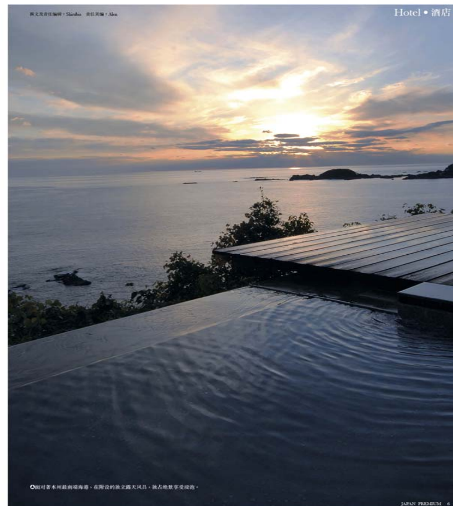
●面对本州最南端海港，在附设的独立露天風呂，独占绝景享受浸泡。

●面对本州最南端海港，在附设的独立露天風呂，独占绝景享受浸泡。●设计时尚的ROYAL SUITE ROOM十分宽敞，拥有榻榻米，最多可4人入住。●全部房间都面对一望无际的大海，通过落地玻璃，单是静静地坐著已很舒服。